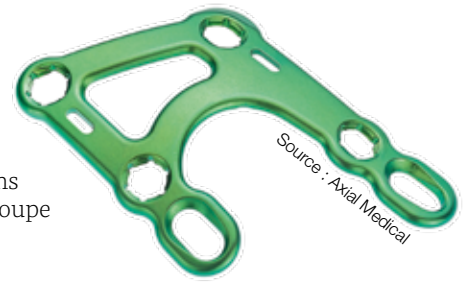
Plaque de Lisfranc

www.axial-medical.com Stands EPHJ : G35 et H35